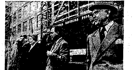
Reforma finansowa i unowocześnienie przemysłu znakomicie przyspieszyły odbudowę kraju. Krzywa produkcji podnosi się do góry. Urządnicom. Na zdjęciu (od prawej): szef fabryki, kierownik, kierownik, kierownik. Na zdjęciu (od prawej): szef fabryki, kierownik, kierownik, kierownik. Na zdjęciu (od prawej): szef fabryki, kierownik, kierownik, kierownik.

W związku z zakończeniem II-go turnusu brygad „Służby Polskie” — Komenda Główna „S. P.” wydała rozkaz, w którym m. inn. czytamy: