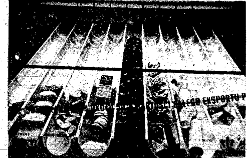
Plastyczna i przez to niezłomna wytrzymała ilustracja naszego eksportu, w którym przemysł Zielni Odzyskanych uczestniczy w 50 proc.