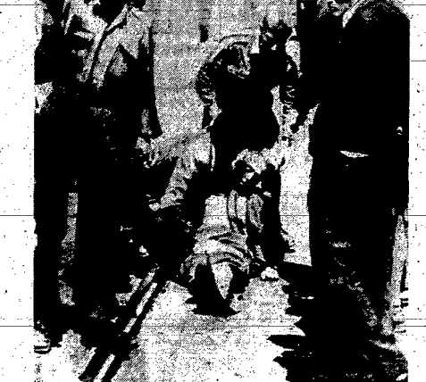
Zamach na Palmiro Togliattiego przywódcę włoskiej klasy robotniczej, nie udało się. Zamachowiec został zraniony i aresztowany. W tle: Togliatti i inni przywódcy partii.

Na ten sam temat wypowiada się „L’Humanité”, stwierdzając, że Reynaud będzie rządził za pomocą dekretów, co przyniesie jedynie korzyść gieldzie i bankierom. Będzie on usiłował zlikwidować przedsiębiorstwa znacjonalizowane i ograniczyć ubezpieczenia społeczne „Humanité” przypomina „dniwień”, że 6 lipca 1940 r. Reynaud, który był wówczas premierem, powołał do rządu Betaina i de Gaulle’a.