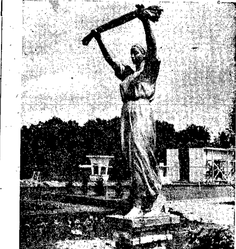
Statua bogini Cerery (rzeźbił prof. Eubianowa z Poznania) — usabiająca żywność i płodność