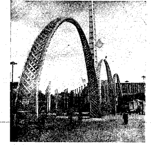
Żabrykowy portel kościoła wrocławskiego w Pawilonie i kopuły — oryginalność tego eksperymentu to, że jest on po prostu fotografią natury, takiej wielkości.

60 fachowych pracowników gastronomicznych, sztab kucharzy oraz 200 kelmerów — oto załoga Pawilonu Restauracyjnego, który będzie mógł pomieścić jednocześnie 3.000 osób. Na soboty i niedziele będą angażowane siły dodatkowe ze względu na wzmocniony ruch, a także dlatego, aby umożliwić stałej załodze większe udział w organizowanych konkursach kulinarnych.