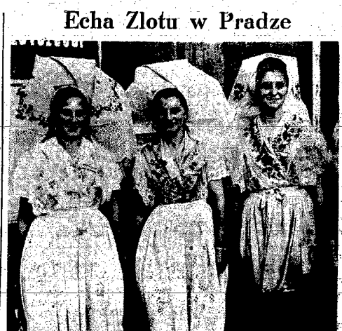
Oto trzy urodzone dziewczęta ze starszego pokolenia słowiańskiego muzyka, które oparło się germanizacji. Przybyły wraz z 200-osobową delegacją na dzień sokółów w Pradze

LAKE SUCCESS. (PAP). — Hr. Bernadotte, zgodnie z rezolucją Rady Bezpieczeństwa... Hr. Bernadotte opuścił Lake Success udając się samolotem do swojej kwatery głównej na wyspie Rodos.