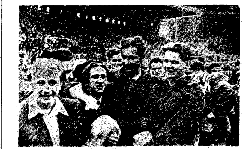
Młody kolarz warszawski — Krótkim się miał największego pecha w czasie wyścigu...