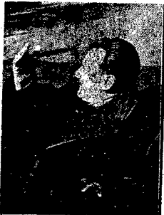
PREZYDENT GOTTWALD z żoną w Warszawie

PRAGA (PAP). — Prezydent Gottwald zatwierdził skład nowego gabinetu czzechosłowackiego powierzając funkcje premiera przewodniczącemu Rady Zw. Zaw., b. wicepremierowi — Antoninowi Zapotocky'emu.