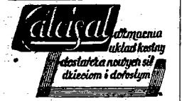
Prof. Państw. Fabr. Chem-Farmac...