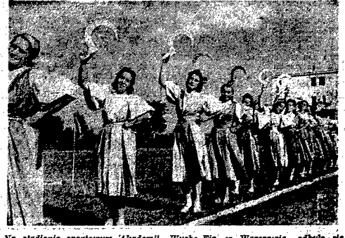
Na stadionie sportowym „Akademii Wych. Fiz.” w Warszawie odbyło się uroczyste zakończenie roku szkolnego dla słuchaczy AWV. Na zdjęciu: taniec „Żniwiarki” w wykonaniu słuchaczy Akademii.

Kurtylowi i detaliści chowają wszelkie towary, podczas gdy mieszkańcy biegają od jednego sklepu do drugiego starając się kupić wszystko co możliwe. Papierosy stały się niedoścignione i cena skoczyła do 30 marek za sztukę (genia robotnika w strefach zachodnich był w wysokości 150 marek miesięcznie). Nie można dostać żywności nawet na kartki. Najbardziej spręż-