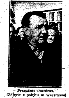
Prezydent Gottwald. (Zdjęcie z pobytu w Warszawie)

Do owej chwili, przygotowywane „zabawo”, „fachowo” - ile te przygotowania były warte, pokazało Powstanie Warszawskie - Londyn szerzył najwięcej na „wólce ograniczoną”, i to pod naciskiem dawnej AK, które, wywołując się spod „dyktetyki”, podejmowało często wąpatkie z AL walce przeciwko Niemcom.