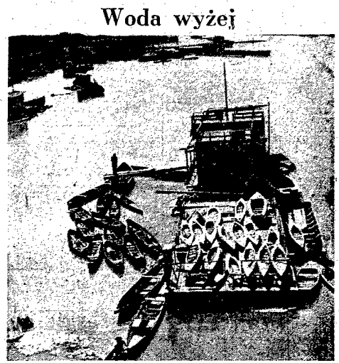
W miejscu, gdzie jeszcze w broń można było dojść suchą nogą, pływająca miny i fale uderzają w przystanki i odcinają przystanki od przystanku. Na zdjęciu: widok na przystanki na Włocławku, przy przystanku w Warszawie. Przystanki nie mają już żadnych znaków i znaków, będąc osadzone w miejscu, gdzie woda jest już wzniesiona.

Posiedzenie Rady Bezpieczeństwa NOWY JORK (PAP) W czwartek wieczorem odbyło się krótkie posiedzenie Rady Bezpieczeństwa, na którym na wniosek delegata Stanów Zjednoczonych Rada wyraziła uznanie dla Folke Bernadotte'a za pomysłne zakończenie rokowań w sprawie 4-tygodniowego rozejmu w Palestynie. „Poż. Tym Rada wyraziła zgodę na prośbę Bernadotte'a, który domagał się wysłania do Palestyny 63 oficerów ze Stanów Zjednoczonych, Francji i Belgii oraz 3-diu ze Szwecji dla obserwacji nad zachowaniem warunków rozejmu. Rada wyraziła również zgodę na oddanie pod rozkaz Bernadotte'a 6 okrętów dla patrolowania wybrzeży palestyńskich. Rokowania będą toczyły się dalej LONDYN (PAP). Mediator ONZ, hr. Bernadotte zapowiedział, że przedstawiciel ONZ nie zawojuje się 4-tygodniowym zawieszeniem broni, lecz