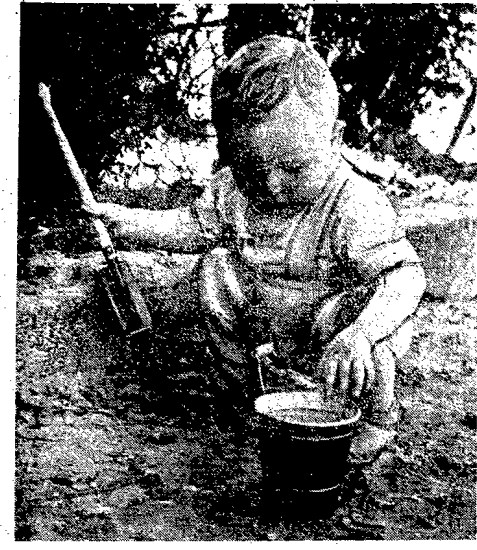
Obecność się z niemcami przed wszystkim dzieci, które nie mogą wrócić do kraju — korzystają ze świętego

Wyniki najazdu i okupacji niemieckiej Polska straciła 6 milionów obywateli. Polskie straty biologiczne nie ograniczają się jednak do tej tak poważnej straty ludzkiej, że nie tylko dwóm tysiącom stracił ludzkość w wyniku straty, którą stracił Niemcy, ale również dotychczas do Niemcy zrabowali narodziło się 200 tysięcy dzieci i poddał je procesowi germanizacji.