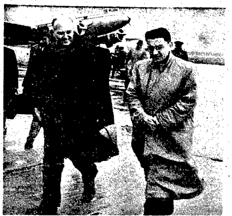
W dn. 5 bm. przybył do Warszawy na zaproszenie P.T.U.R. posel do parlamentu brytyjskiego K. Ziliacus (na lewo). W czasie swego paradotnego pobytu w Polsce, posel Ziliacus wygłosił w rozmaitych miastach odczyty o sytuacji klasy robotniczej w Anglii. Na zdjęciu pos. Ziliacus w chwili po wygłoszeniu na lotnisku w Warszawie...