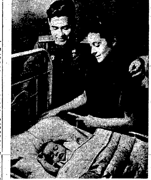
Bohater drukowni w ul. St. w ośrodku. Opowiesci o prawdziwym bohaterstwie i poświęceniu w czasie wojny. Bohaterowie naszej powieści.