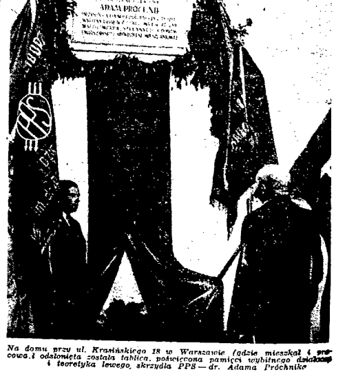
Na domu przy ul. Krasińskiego 18 w Warszawie (gdzie mieszkał i pracował) odmalowana została tablica pamiątkowa...