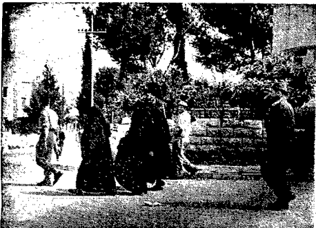
Zobaczcie Hagau przeprowadzają ulicami Jerozolimy ludność cywilną w obrotu zamachów arabskich. Na zdjęciu: zakonnice pod opieką żydowskich żołnierzy.