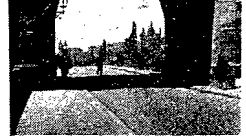
Wjazd na most Karłow. Jest to jeden z kilkunastu mostów, łączących dwie przedzielone Włtawą części Pragi.

Wspólna jest droga robotnika, kłopotliwa, intelektualna, pracująca. Nowej Polsce. — Wspólnie jest ich dążenie do zapewnienia Polsce postępu, rozwoju i siły. — Wspólnie też musi być wysiłek mięśni i mózgu.