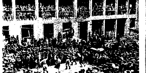
Na terenie budowy gmachu Min. Przemysłu we pl. Trzech Krzyży w Warszawie, otwala urzędowa ciekawostka: w budowie przetrwał budowlany spół-taneczny Zw. Zawod. Pracowników Budowlanych wykonał także In. Spół. Robotnicy zatrudnieni przy budowie.