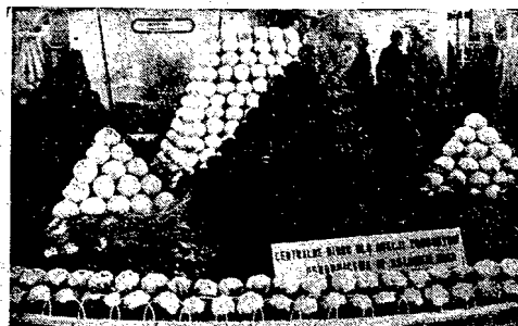
Przemiany gólów kapsuły... Centralnego Biura dla produkcji...