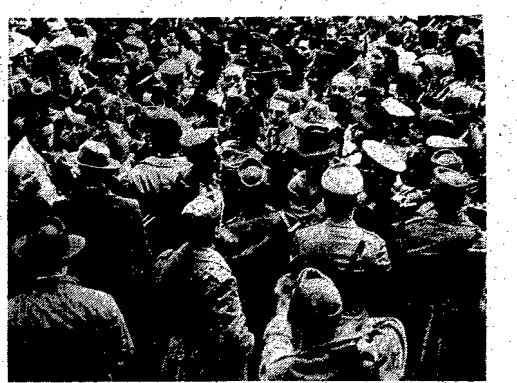
W Wołoszech odbyły się uroczyste wybory. Na zdjęciu Gasperi ogromną manifestacją przedwyborczą w Mediolanie. Policja de Gasperi'ego w brzośny sposób rozpruza uczestników ulicy.