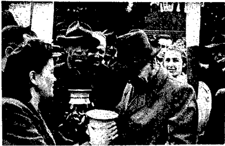
W Wałbrzychu na Dolnym Śląsku odbyły się centralne uroczystości, związane z obchodem "Tygodnia Ziemi, Odkrywców". W Wałbrzychu istnieją cztery fabryki "Gigantów", które produkują urządzenia do premiowania Górnice wyrobę tejże fabryki, jako dary dla Prezydenta R.P., premiera i gubernatora.