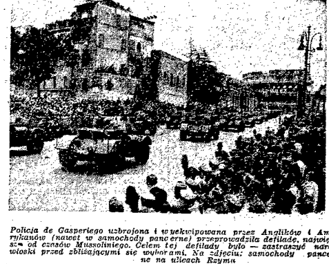
Policia de Gasperi ubrana i w toku powołania przez Anglików i Amerykanów (niektórzy w samochodach pancernych) przeprowadzają defiladę, natychmiast od czasu Mussoliniego. Celem tej defilady było — zwrócić uwagę włoski przed zbliżającymi się wyborami. Na zdjęciu: samochody pancernych na ulicach Rzymu.