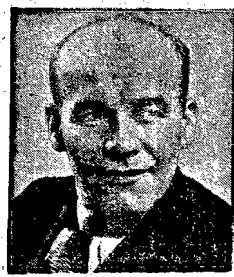
Wicepremier, Wiesław Gomułka