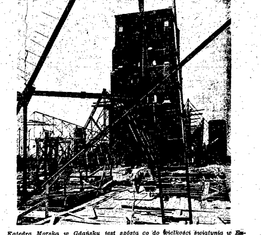
Katedra Morska w Gdańsku jest zabita do wysokości szczytów i wzniesienie. Na zdjęciu: fragment remonu ławianego, którego powiększenie wynosi ponad 20 tys. m. kw.