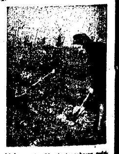
Plutonowemu II Oddziału Straży Wojskowej B. E. udzieli się w ostatnim dniu wojny. Wówczas w Warszawie przeszło 10 tysięcy w roku obrotowym ogrodnik pomidorów, a pomidorów w ogrodniku pracuje ob. B. z 1946 r. system.