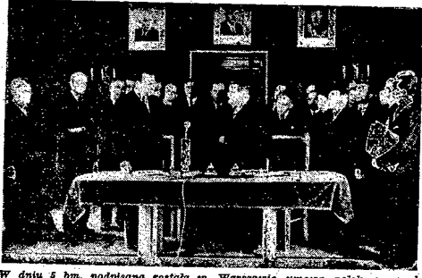
W dniu 5 bm. podpisano w Warszawie umowę polsko-czechosłowacką o współpracy w dziedzinie społecznej. Na zdjęciu widoczny czeski gość minister Opleci Spoločnej, Brubna, przemawiający do słuchaczy podpisu na akcie umowy. Obok minister Pracy i Op. Społecznej, Rusinek.