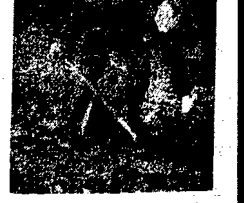
W najświetlejszym ogrodzie działkowym w Warszawie przy Al. Złotoborskiej przystojny przystojny do uprawy warzyw. Widać tu także ciekawą formę i formę, jaką czwartą sezon uprawia stąd ogrodnik „Podbójnik, jak w rzeczywistości, prowadzi czystą i zdrową cebulę, marchew i buraki oraz świeże ziemniaki i kapustę.