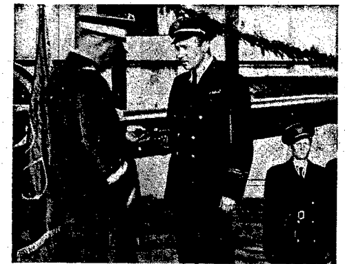
W Warszawie odbyła się uroczystość dekoracji odznaczonych...