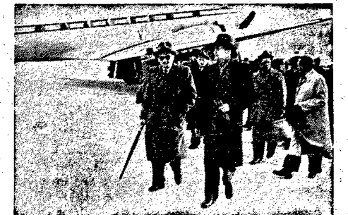
Do Warszawy przybył czeskosłowacki minister Onieki Spolecnej, Erhan Widziny (po prawej) w towarzyszyście ministra Pracy i Op. Społecznej, Kuzinka, na lotnisku na Okęcu. W dn. 5 b. m. nastąpiło podpisanie umowy polsko-czeskosłowackiej o współpracy w dziedzinie społecznej.