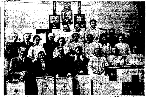
W całej Polsce prowadzona jest akcja szkolenia weteranów przodownic zdrowia...