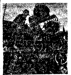
Studowanie z lądowego metalu, wyposażone w silnik elektryczny, umożliwia pokonywanie trudności terenowe.