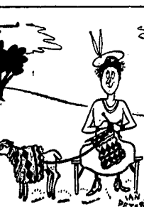
Humor francuski SAMOWYSTARCZALNOŚĆ

Półfinały mistrzostw w Warszawie rozpoczyna się w maju. Wezmą w nich udział wszyscy gracze, którzy uczestniczyli w turnieju jak obrońca tytułu będzie grał bez pośrednio w finale. Od rozgrywek półfinałowych zmienił się porządek mistrzostw wie krajowej.