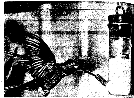
Wspaniale zdjęcie kolibra, który pije wodę ze specjalnego pojemnika. Ptak zawiązał nierzuchą mo w powietrzu.

Odkrycie to może doprowadzić do jasnego zapadnięcia, dlaczego mężczyźni zapadają częściej niż kobiety na wrzody żołądka, niż kobiety. (1)