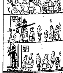
Humor angielski FAKTY MOWIA... Redaktor: K. MUSZAŁOWNA