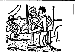
ZONA NIE MOŻE PRZYJSC. PROHILA, ZEBYM JA DZIS ZASTA...