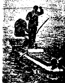
Wymyślono na świecie łódź podwodną ze stopni wynalazczy „na pokładzie”