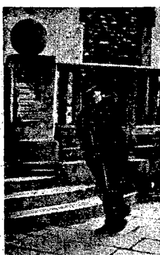
ostatnie wiadomości mocno dają się we znaki... Trzeba dobrze przemyśleć, by go wiatr nie porwał.

Kapryśna Wisła uspokoiła się wreszcie. Poziom wody spada, minieła groźba powrotu zimy i obniżki temperatury. Na filarach mostu Książęcego (Śląskiego) zjawili się znów robotnicy. Do pracy wzięli się z żuwaw. Do lipca musza być filary obudowane, roboty pozostało jeszcze kilka. Trzeci, czwarty i piąty filar wybudowanego dopiero nad wodą. W drugim i szóstym musza być przebudowane górną podporę. Trzeba w nich nadać nowe warstwy bloków granitowych, na troche zmienić zewnętrzny kształt, aby nie różniły się od obudowywanych filarów, których projekt opracowano wg nowoczesnych założeń architektonicznych.