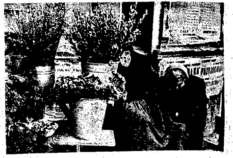
Te drogie handlarzyki baz i kwiatów w potand małego ruchu w ich brzozy, dźwierżąc się. Obiekty fotografujące niezmierzli śpiąco sprządzają.

W czerwiec wreszcie przyspają robotnicy Mostostatu do przebiecia przedłużenia arterii W-Z przez teren obecnego Dv. Wileńskiego, przez który nowa trasa będzie przebiegać aż do ul. Radzymińskiej. (A3)