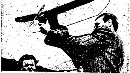
Data 21 marca br. na terenie lotniska Legia w Warszawie została otwarta Wystawa Modeli Samolotów, zorganizowana przez stołeczną ZWM.