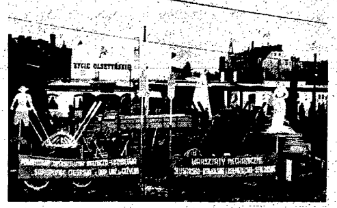
W dniach 19, 20 i 21 bm. odbyły się w Olsztynie Targi Wiosenne o charakterze rolniczo-przemysłowym.