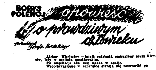
Altkrowiciel - tożsaki radziecki, strzeżony przez Niemców, wzięty do niewoli. Władcy w sprawie strażnicy nie rozmawiają go.

Do Zdziesiątej przyjeżdża nadal repatrianci indywidualni, powracający na własną rękę z różnych krajów europejskich. Ostatnio przybyli z Austrii i Anglii i 2 osoby z amerykańskiej strefy okupacyjnej Niemiec.