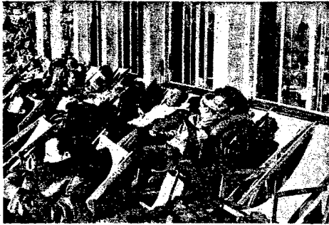
Rozkosze są pierwsze promienie wiosennego słońca, zwłaszcza, gdy z ich dobrodziejstwa korzysta się podczas wczasów na tarasie hotelu na Kasprowym Wierchu w Tatracach.

Od pewnego czasu na terenie Stanów Zjednoczonych trwa coraz silniejsza kampania, mająca na celu rehabilitację narodu niemieckiego wśród obywateli amerykańskich i przed całym światem. Metody stosowane w tym celu przez stowarzyszenia niemieckie w liczbie 20.000 oraz pranicieckie kółka amerykańskie — nie są nowe.