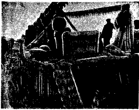
Fak oblodzone statki wypływają do portu w Gdyni. (Do artykułu poniżej)