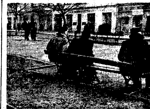
Choćby jeszcze jest chłodno, lawki w czesko-słowackich Ałtjach znajdują już swoich amatorów.