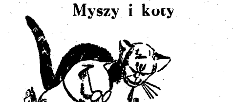
Dziennik brytyjski „Manchester Guardian” donosił niedawno: „St. Ejdenskość amerykańska wywołała w Europie i milionach amerykańskich, celny wyjazd szarogłowy, który zjadł żywność, tak potrzebna Europejczykom.”

USTKA POTRZEBUJE LEKARZY USTKA. Miasto portowe Ustka posiadające ok. 4 tys. ludności ma tylko jednego lekarza. Oprócz Ośrodka Zdrowia nie ma w Ustce żadnej placówki sanitarnej. W tej chwili nie ma nawet i jednego lekarza gdyż wyjechał on przed laty. Wobec tego pozostali bez żadnej opieki lekarskiej i nie tylko miejscowi, ale również z okolicznych wiosek.