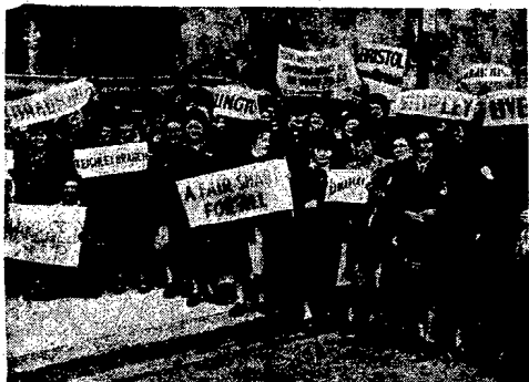
Przed parlamentem w Londynie odbyła się osobliwa demonstracja. Oto angielskie starsi panowie, liczące ponad 55 wiosen, wystąpili z żądaniem wypłacenia im stałej renty. Należy przypuszczać, że w podobny sposób parlament uchwalił rentę, która faktycznie ekwiwalentem za starość jest.