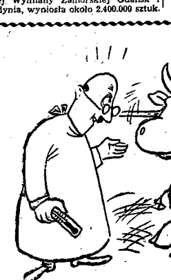
Próbując pokonać język

1000 paczek, które nadeszły w r. ub. drogą morską przez Urząd Portowy w Gdyni, wyniosła 2.400.000 sztuk.