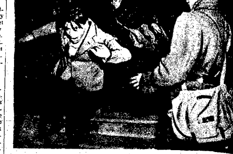
Policja włoska aresztuje demonstrantów na ulicach.