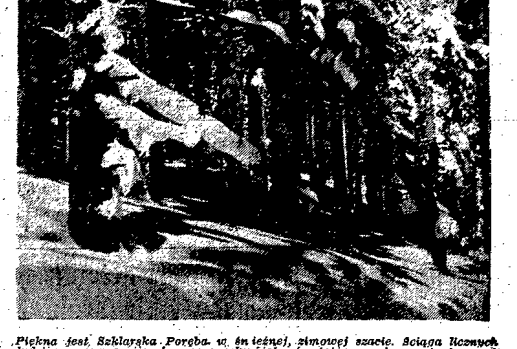
Piękna jest, Szklarska Poręba w śnieżnej, zimowej szacie. Ściąga licznych ludzi, pragnących wypocząć, jak również gromady amatorów wiat.