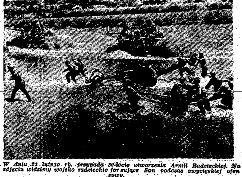
W dniu 23 lutego r. przypada 30-lecie utworzenia Armii Radzieckiej. Na zdjęciu widzimy wojsko radzieckie forsujące Białą podczas zwycięskiej ofensywy.