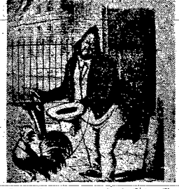
Basunek satyryczny: b. król i młode Ludwik Filip...