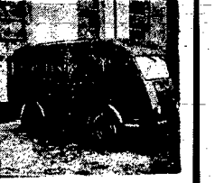
Godziennie raz nowoczesny samochód zabiera życie, pachnie jak...