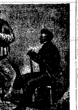
Nieswojkę charakterystyczna rycina. Robotnik do przedstawiciela liberalizmu...

Proletariat dał republice swą ulność, swe złudzenia i trzy miesiące cierpliwego złodowania.