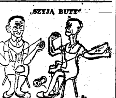
„SZYJA BUTY” Schuman i Schumaacher „szyja buty” swoim narodom grubymi, amerykańskimi rękami.

Miał się odbyć poranek autorski w Prezydium Rady Ministrów, w którym również miał wziąć udział.