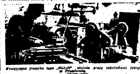
Wznowienie imprezy typu „Głuch“ ułatwia prac robotniczymi fabryki w Pruszkowie.

Kolej Księgarzy Księgarzy ufundowało samorządnie bibliotekę dla do-