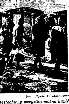
Na najulekajszym targowisku Częstochowy wszystko można kupić.