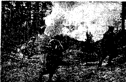
Zainteresi i Armii Polskiej to bitwa o Wal Pomorski. Bitwa ta decydująca o sukcesie Berlina i tym samym o decydującej bitwie o wolność naszego kraju.