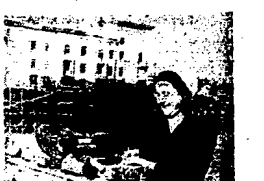
Test Dramatyczny im. Gorkiego w Stalingradzie po odbudowie