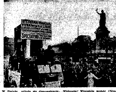
W Paryżu odbyła się demonstracja protestacyjna artystów i pracowników filmowych...