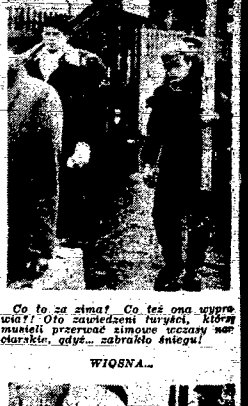
Co to za zima! Co to jest ona wspaniała! Oto zaskakują burzy...