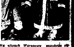
W Warszawie wycieczka z wycieczką...