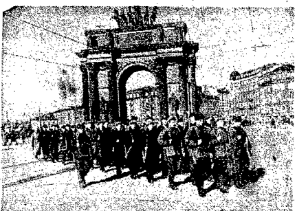
Jezielnia 1941 r. Oddział robotników leningradzkich wygrywa na białki front.