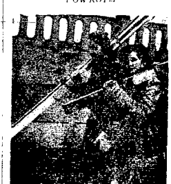
Koniec ferii zimowych... Trzeba po raz drugi pokryć szuternis i wjechać w deszczowe dni. Zamienia nury na pismo, notes i książki.