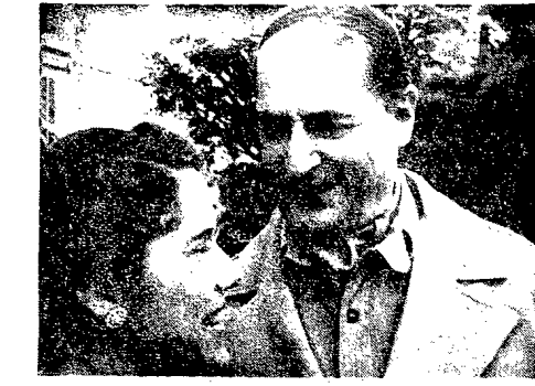
Generał Mac Arthur, amerykański wielkorządca w Japonii, chwycony przez obiektyw fotograficzny w momencie przyjaźnieliści pogawędki z przedstawicielką...