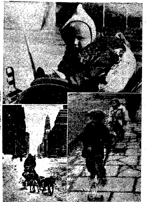
Tegoroczna zima obfituje w kaprysy zupełnie niezwykłe. Mróz, zawiązała śnieżna, deszcz i wiosenne ciepło następują po sobie bez żadnej ceremonii. Natomiast w Nowym Jorku spadły śniegi jak obficie, że na ulicach powiałoby się — oczywiście do zabawy — eskimoskie zaprzęgi psów.