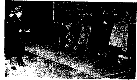
Chicago. Miasto gangsterów. Policja zatrzymuje przechodniów rozbitek; ręce do góry, twarz do ściany. Po czym przeprowadza rewizję, której wyniki często bywały sensacyjne.