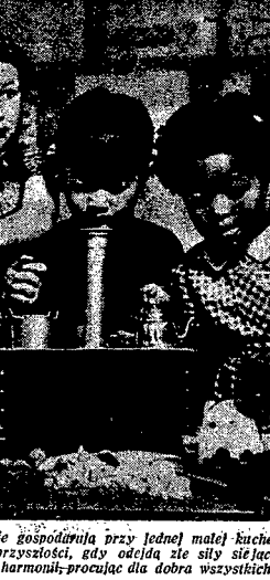
Oto dzieci wszystkich ras świata zgodnie gospodnią przy jednej małej kuchence, aby przygotować wspólny dla wszystkich posiłek. Wierzymy, że i w przyszłości, gdy odejdą ze sily sielące nienawiść, także ludzie dorosli będą żyć w pełnej harmonii-pracując dla dobra wszystkich, całej ludzkości.