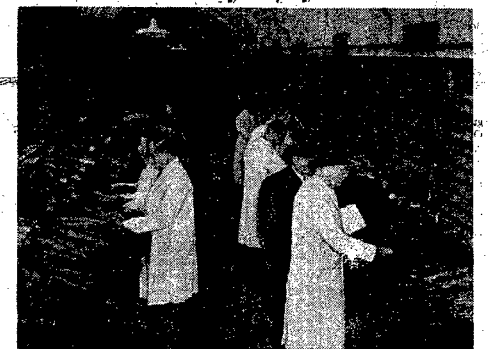
W Londynie odbyła się licytacja srebrnych łańcuchów kanadyjskich.