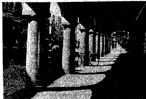
Jelenie Góra — widać tu świątynię

mi, lecz są następstwem różnicy poglądów w sprawie przyszłości Niemiec.