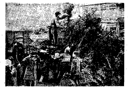
Na placach stolicy zazielenili się już stopy choinek. Będą one w dniu wigilijnym radością tysięcy dzieci.