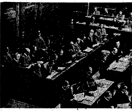
Norymberdze przed trybunałem amerykańskim toczy się obecnie proces hierarchów Rasse und Siedlungshauptamt...