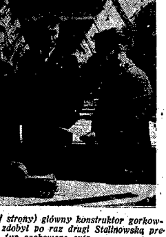
...złożył główny konstruktor gorkowski zaobcył po raz drugi Stalinoską...