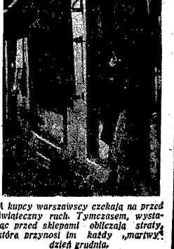
A kupcy warszawscy czekają na przed święteczny kram. Tymczasem, wstępując przed sklepami — obciążają strąty, która przynosi im każdy „marwik” dzień grudnia.