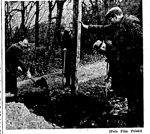
W lesie przy sadzeniu drzew w parku w Natolinie widać udział Prezydenta R. P. Ob. Bolesław Bierut (pierwszy po lewej stronie).