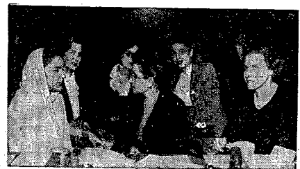
Grupa kobiet, przedstawicielek Organizacji Narodów Zjednoczonych, biorących udział w komisji społecznej, dyskusje z ożywieniem. W komisji zasiadają przedstawicielki: Pakistana, Danii, Szwecji, Iranu, Szwajcarii i Indii.