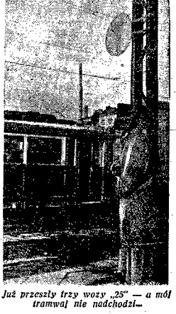
Już przeszły trzy wozy „25” — a mól tramwajowy nadchodzi...