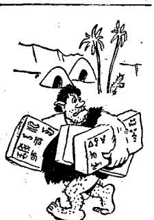
Redaktor w epoce kamiennej.

„Od 1927 r. jestem członkiem spółdzielni mieszkaniowej „Skarb” przy ul. Koszalińskiego 8 - 12 na Żoliborzu. Mieszkałem w tej spółdzielni od 1928 r., t.j. od ukończenia budowy, we własnym mieszkaniu składającym się z 3 pokoi, kuchni, łazienki i pokoju służbowego. Rodzinna moją składa się z czterech osób: żony, córki i syna. Później z Telegrafów, żona jest nauczycielką szkoły średniej, syn kołczył Hecem dla dorosłych, córka - po maturze zapisała się do Wyższej Szkoły Nauk Poln. Ze względu na brak środków materialnych, nie mogiliśmy urodzić zimą 1945 r. do Warszawy. Mieszkanie moje na Żoliborzu zostało zajęte przez dwie rodziny, a później dokwaterowano jeszcze dwie. Wiosną 1945 r., kiedy był jeszcze dwa pokoje wolne - urodziłem się, ale nie przydzielono mi mieszkania, gdyż byłem wówczas emerytem i jako takim nie wolno mi było mieszkać w Warszawie. Zakaz ten został później zmieniony uchwałą Prez. Rady Ministrów.