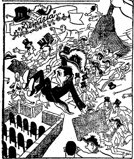
Zelazna miotła ludu rumuńskiego tuż przed M. Spr. Zagranicznych...