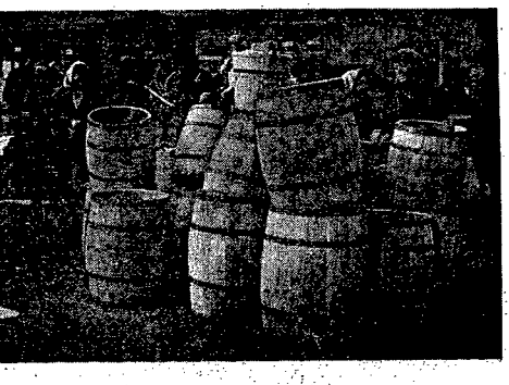
Na „Zawodzie” — głównym targowisku Częstochowy, niczego nie brak. Są i beczki do kiszenia kapusty — będzie smaczny bigos.