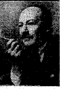
Min. Spraw Zagranicznych Zygmunt Modzelewski

22 b.m. w godzinach porannych, obradowała Komisja Spraw Zagranicznych Sejmu, na której zabrał głos minister spraw Zagranicznych, Zygmunt Modzelewski,