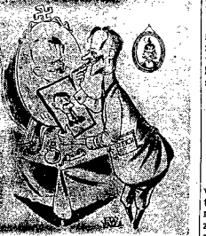
Schumacher: Na prawo, to podobnie jest zastawiania.

Z prasy: Dr. Schumacher ma zostać premerem „Westdeutschland“.