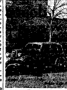
W miasteczku naszym pojawiają się coraz więcej taksówek, lecz nie przedko jeszcze wypły one dorozki konne.