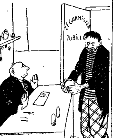
— MOŻE PAN ZREPERUJE ZEGAR W TEL BOMBIE, BO JUZ SIĘ 5 MINUT OPÓZNIŁ.