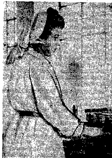
Automat do pakowania ka stek bulionu „Spółem”