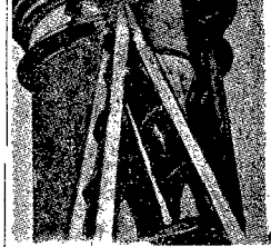
Wiosna i latem namyślano się czy i kie dy rozpocząć malowanie ulicznych Mosków, w których miesiąca się transformują dzielnicy. Roboty rozpoczęto niedawno.

Dobiegający ażeścieście kresu tydzień wykazał jednak, że rzeczy najgorsze mogą niekiedy okazać się najlepszymi. Ze nawet bomba atomowa może wyrzucić dobroczynny wybuch.