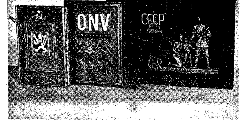
Organizacje zawodowe i społeczne CSR miasta wsty, gminy, fabryki wysyła- jących narodom ZSRR podziękowania z okazji 30-roczyca Wielkiej Rewolucji...

obrony przed komunistyczną rewoltą, Austriacki Partii Ludowej z taką e-