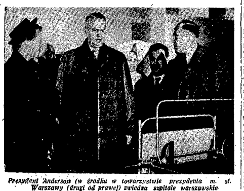
Prezydent Anderson (w środku w towarzystwie prezydenta m. st. Warszawy (drugi od prawej) zwiedza szpital warszawski