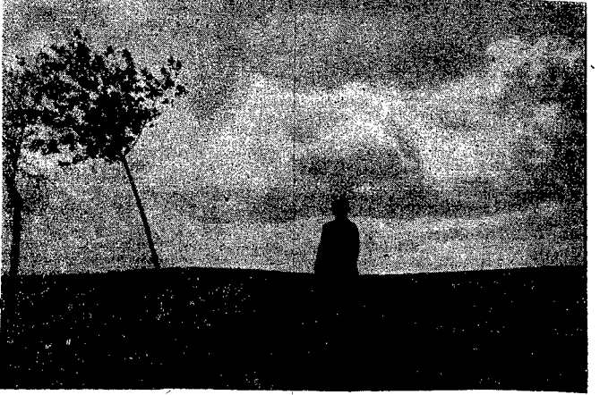
Jak co roku — w dzień zaduszy y hula jesienny wiatr.