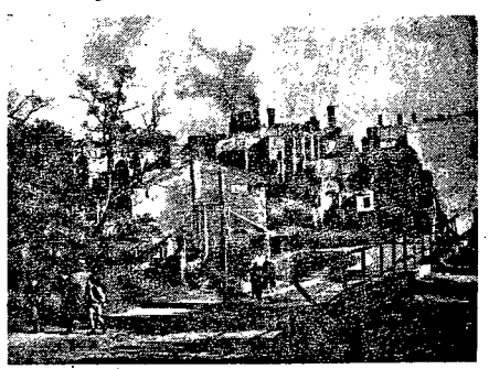
Nawet starzym warszawiakom trudn o będzie domyśleć się, że zdjęcie po wyżej reprodukowane to nie obraz starożytnego miasta, a fragment dzisiejszego Powiśla z dymiącymi kominami Elektrowni Warszawskiej