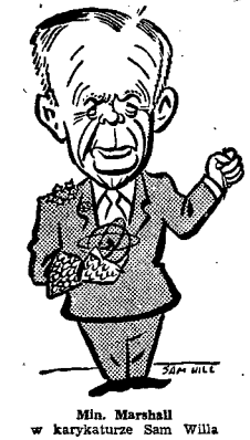
Mln. Marshall w karykaturze Sam Willa

29 b. m. Sesja jesienna Sejmu Marszałek Sejmu otrzymał w dn. 21 b. m. następujące zarządzenie Prezydenta Rzeczypospolitej z dn. 20 b. m.: „Na podstawie art. 7 ust. 2 ustawy konstytucyjnej z dnia 19 lutego 1947 r. o ustroju i zakresie działania najwyższych organów Rzeczypospolitej Prezydent wzywuje Sejm do ustnowej sesji w swych siedzibach w dniu 29 października 1947 r.”