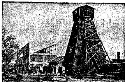
Wieża szwytu nowej kaptańki węgla „Gigant”, która połączy wyzwywałe kręgi sąsiadujących kaptańki Mikulcewo, Rokibitka i Michoulice. „Gigant” po uruchomieniu będzie wydzielala 3 miliony ton węgla rocznie.